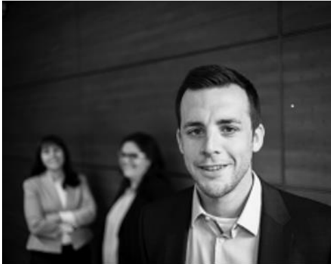
Sascha Wenn Beschlusskammer 8